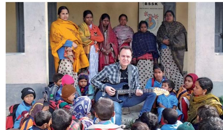
↑ EL GUITARRISTA JUAN VALDIVIA, DURANTE LA VISITA QUE REALIZÓ A LA INDIA PARA GRABAR EL CLIP QUE APOYÓ A ESTE PROYECTO.

Ampliar los límites de la educación en zonas rurales de la India y frenar el abandono escolar, son los dos objetivos con los que se ha puesto en marcha la Escuela Juan Valdivia en el municipio indio de Baruipur. La iniciativa ha contado con el apoyo de los padrinos y madrinas de nuestra organización, así como el de una campaña de microdonaciones en la que se han involucrado el propio guitarrista y todos sus seguidores.