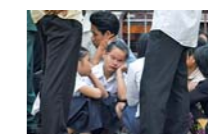
← NIÑAS VÍCTIMAS DE ABUSOS SEXUALES EN EL JUZGADO DE PHNOM PENH.