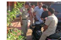
← UN EXTRANJERO SEGUIDO POR PROTECT ES INTERROGADO POR LA POLICÍA.

Desde 2003, el equipo de Protect ha investigado 472 casos, ha asistido social y legalmente a más de 600 niños y niñas víctimas de abusos. La colaboración con las autoridades locales ha dado como resultado la detención, juicio y condena de más de 180 agresores (los alemanes mencionados al comienzo fueron sentenciados en 2007 a 12 y 28 años de prisión). "Hace 10 años, ningún policía o funcionario de los tribunales creía que los niños pudieran ser víctimas de abusos sexuales y nadie creía a los niños. Los