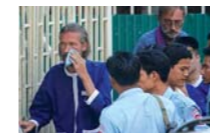
← DOS ALEMANOS CONDENADOS POR ABUSAR SEXUALMENTE DE CUATRO NIÑAS.