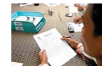
← PARTE DE LOS 16 INVESTIGADORES DEL EQUIPO PROTECT EN UNA REUNIÓN DE TRABAJO.