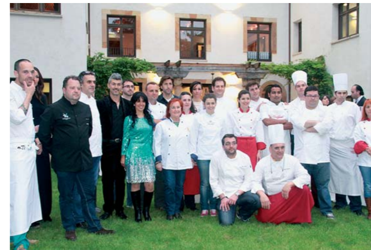
COCINEROS Y GUIANDERAS JUNTO A ALGUNOS DE LOS COMENSALES.