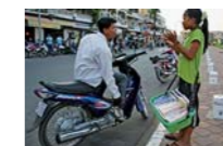
← UN JOVEN INVESTIGADOR CONVERSA CON UNA NIÑA VENDEDORA DE LIBROS.