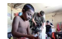
EL NIÑO PROTAGONISTA DE LOS MONSTRUOS NO EXISTEN, DURANTE EL RODAJE.

El cortometraje ha recibido 27 premios y varias menciones en distintos festivales de España, Italia, la India, Grecia, Australia, Perú y Uruguay. Puede verse entrando en nuestro canal youtube de www.protectgh.org ☺