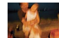
← UN EXTRANJERO EN ACTITUD SOSPECHOSA CON UNA NIÑA CAMBOYANA, EN PLENO CENTRO TURÍSTICO.

L a sala del juzgado de Phnom Penh estaba repleta y no corría un soplo de aire. En aquel ambiente espeso, cuatro niñas vietnamitas darían su testimonio contra los pederastas alemanes que habían abusado de ellas. Las cuatro permanecían cabizbajas, estremecidas por el revuelo periodístico que había levantado el caso. Ellos, al contrario, se mostraban altaneros, seguros de sí mismos. De un lado estaban las niñas con una tutora y a escasos tres metros los pederastas. Entre víctimas y victimarios no había ningún tipo de barrera, biombo, panel... llamadlo como queráis. Era el año 2007 y los casos de abusos sexuales cometidos por extranjeros habían comenzado a destaparse y a ser juzgados en Camboya, al modo y ritmo camboyanos.