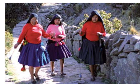
↑ LAS MUJERES CAMPESINAS SON QUIENES ENCUENTRAN MAYORES DIFICULTADES PARA ACCEDER A LA JUSTICIA.