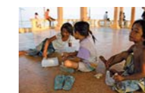
← UN GRUPO DE NIÑAS SE DISTRAE EN EL PASEO DE LA CAPITAL CONOCIDO COMO RIVER SIDE.