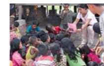
← NIÑOS CAMBOYANOS DURANTE UNA CHARLA SOBRE LA PREVENCIÓN DE ABUSOS.