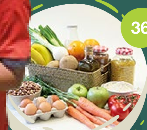
CESTA DE PERÚ

El contenido de cada una de las cestas incluye productos básicos y necesarios para alimentar durante una semana a una familia de 6 miembros.