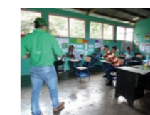
← LAS CAPACITACIONES EN EQUIDAD DE GÉNERO Y NUEVAS MASCULINIDADES VAN DEDICADAS A HOMBRES Y MUJERES DE LA COMUNIDAD.