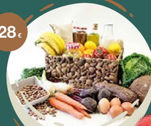
CESTA DE COLOMBIA