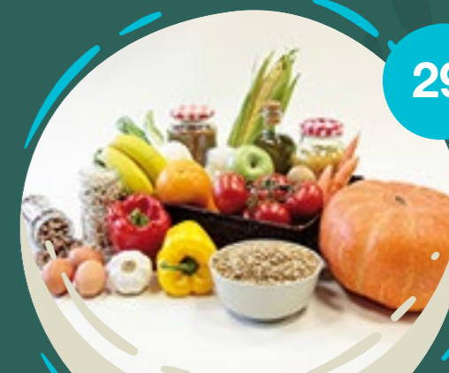
CESTA DE BOLIVIA