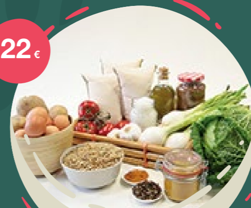
CESTA DE LA INDIA