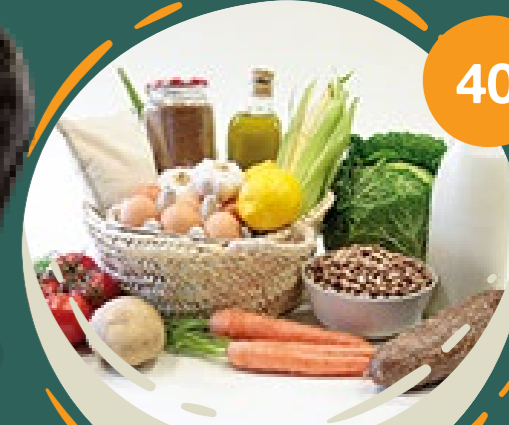
CESTA DE GUATEMALA