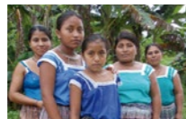
↑ MUJERES PETENERAS. GLOBAL HUMANITARIA

Publicación impresa 100% en papel reciclado