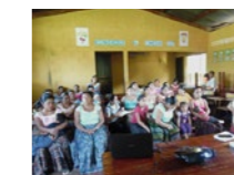
← LA IMPLICACIÓN DE LAS MADRES EN LA GESTIÓN DE LOS COMEDORES AUMENTA SU PAPEL EN LA COMUNIDAD.