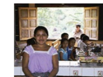
← LAS MADRES ENCARGADAS DEL COMEDOR RECIBEN FORMACIONES EN PREPARACIÓN DE ALIMENTOS, ADMINISTRACIÓN Y GESTIÓN.